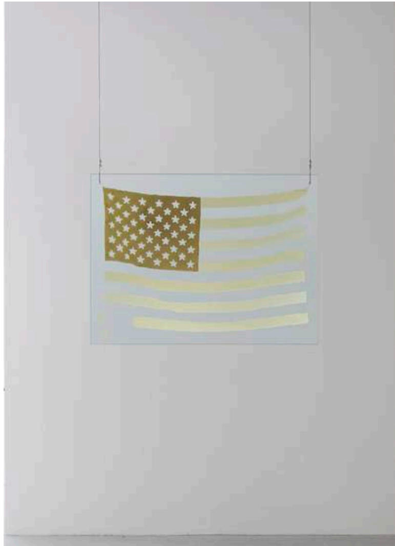
Untitled, 2012 Silver on glass, metal 76,2 x 101,6 cm