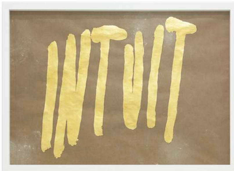
Selftitled (INTUIT), 2012 Gold and brass on paper 68,7 x 98,5 cm, framed