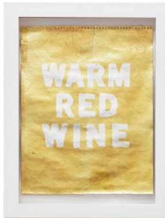
Selftitled (WARM RED WINE), 2013 Aluminium on brass and paper 35 x 28 cm, framed