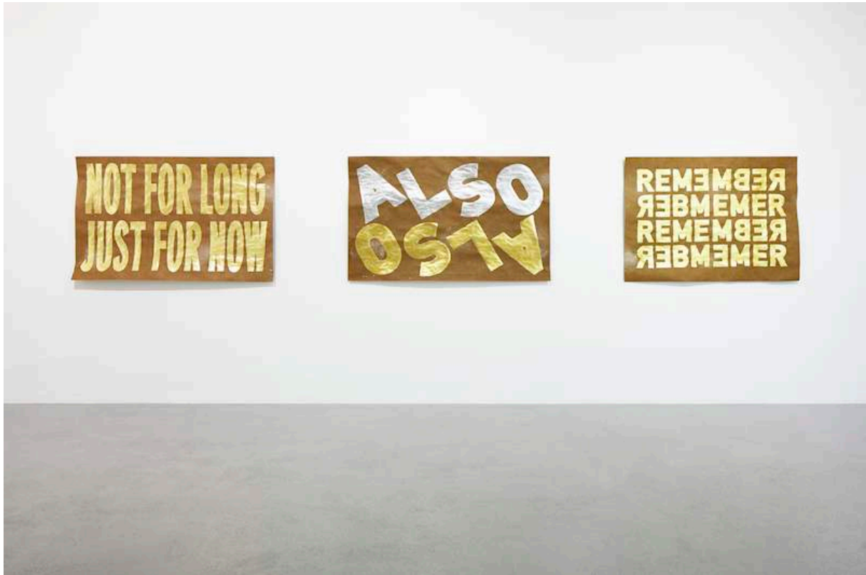
Selftitled (REMEMBER), 2012 Gold and brass on paper 99,1 x 162,7 cm