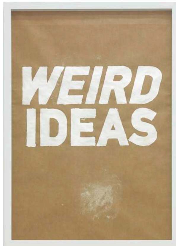
Selftitled (WEIRD IDEAS), 2012 Silver and aluminium on paper 101,6 x 89 cm