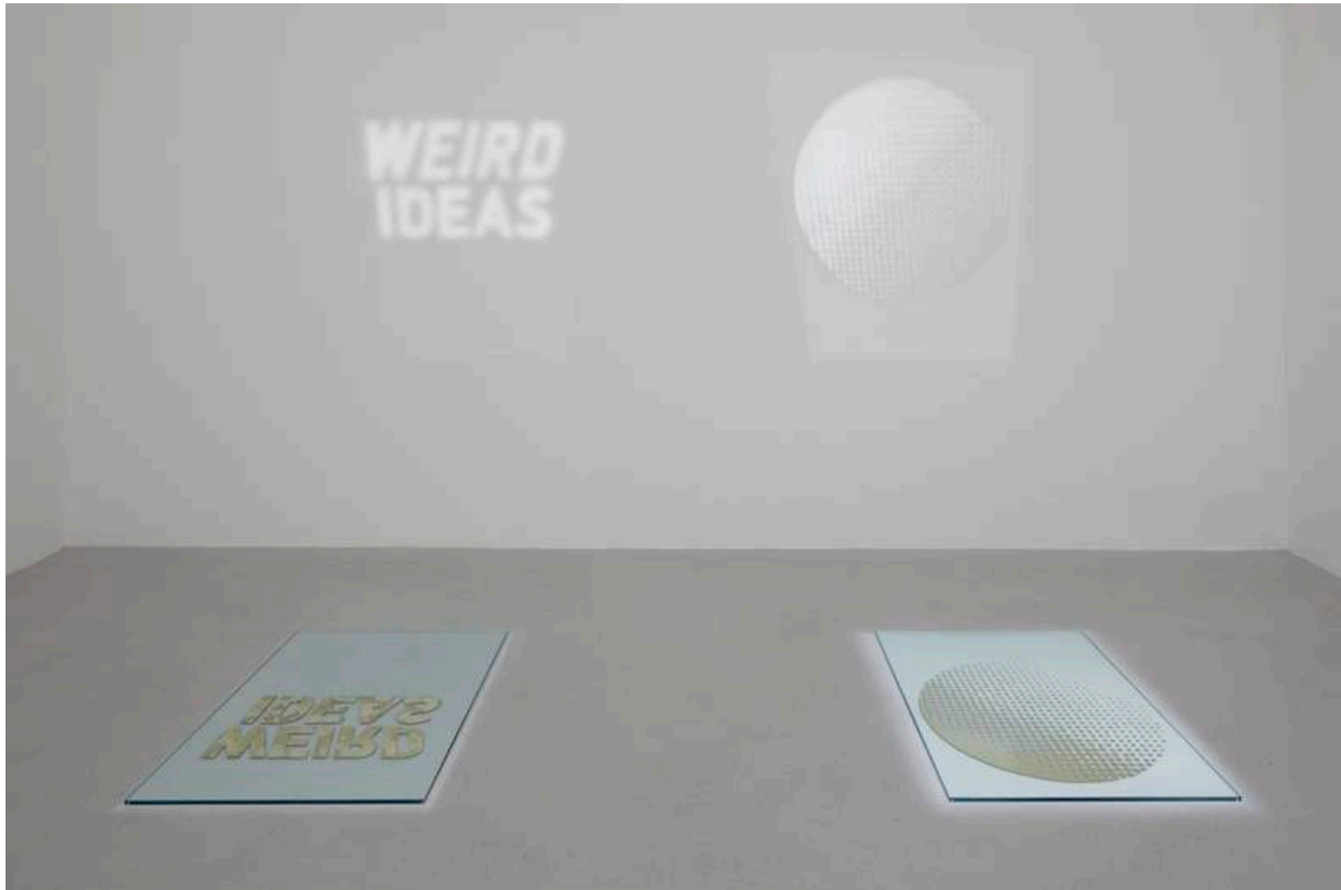
Untitled, 2012 Silver on glass 1 x 76,2 x 101,6 cm